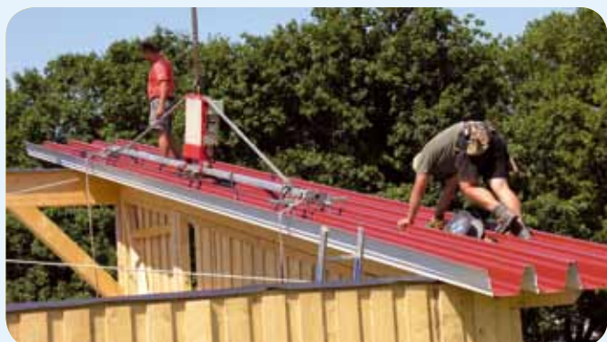
Opération de montage rapide avec seulement deux employés