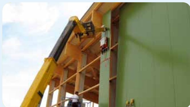
montage de bardage