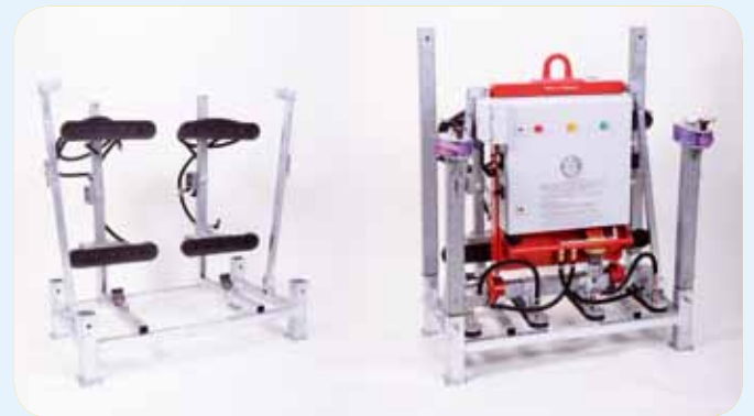
Chargement aisé avec le Storeboy