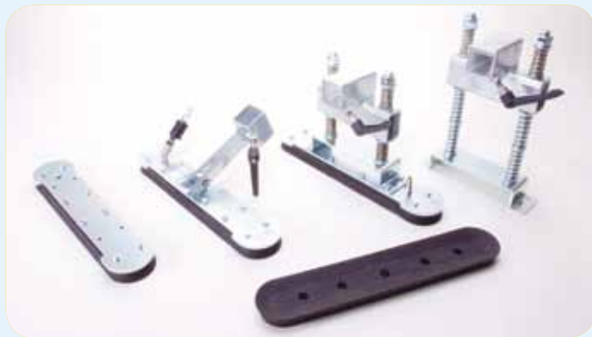
Adaptation des ventouses en fonction des contraintes du panneau